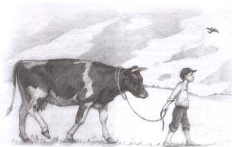
Глава 1 ПЕРЕГОН

Мишкина деревня затеряна в краю лесов... Но и сюда приходят фашисты, устанавливая свои порядки — например, забирают зерно, увозя его в Германию и обрекая жителей на голод. Конечно, многие местные ушли в сопротивление. И вот здесь Мишка оказался незаменим. Никто лучше него, сына лесника, не знает окружающую местность. Спрятать беззащитных мирных жителей на острове, затерянном среди болот, или незаметно провести разведку — вот его вклад в победу над врагом.