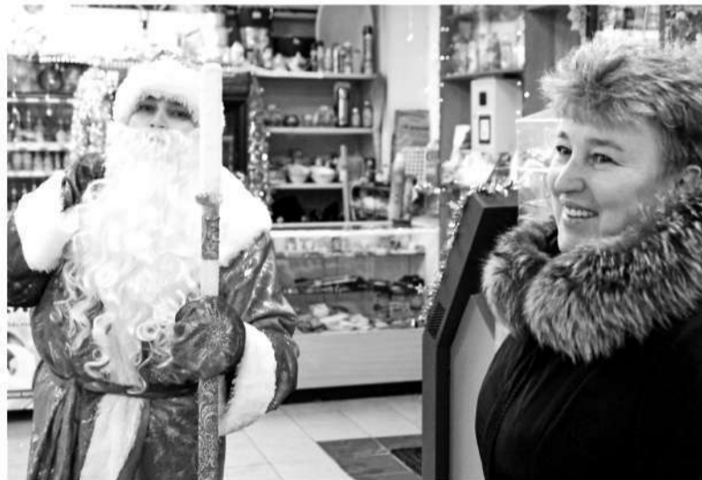
● А это добрый Дед Мороз из с. Арманыха с большим мешком новогодних подарков (ИП А. А. Воронин)