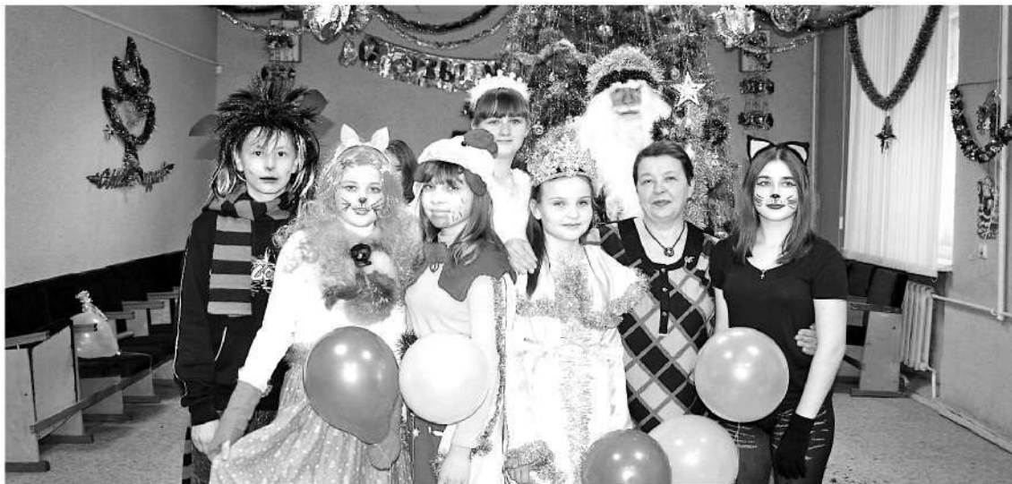
● Нарядные сказочные персонажи порадовали детвору

ТАК пусть же вместе с боем курантов в каждый дом, в каждую семью придут добро, счастье, благополучие, успех, здоровье, много-много приятных и волнительных моментов, появятся новые перспективы, повысится благосостояние, появятся надежды на должданные перемены, а тепло и уют домашнего очага привлекут желанных гостей. Пусть в Новом году всех нас окружают только добрые, честные, умные и приятные люди! Ободрите уставших, улыбнитесь тем, кто одинок — и жизнь сторицей отплатит за вашу заботу. Пусть в мире будет как можно больше добрых и отзывчивых людей, всеяющих веру и надежду, помогающих осуществ-