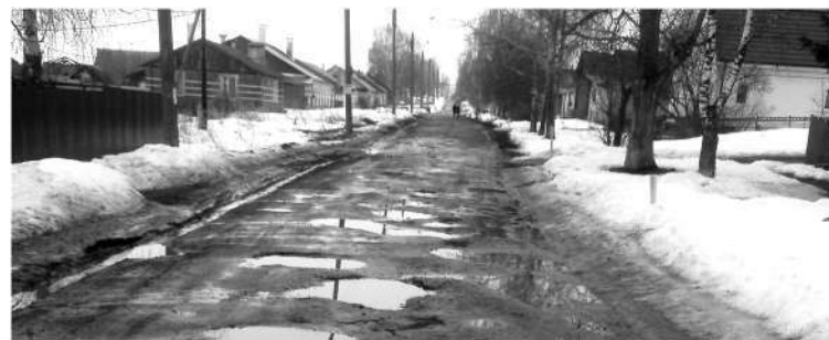
● Дорога по улице Советской в Тепелеве – яма на яме