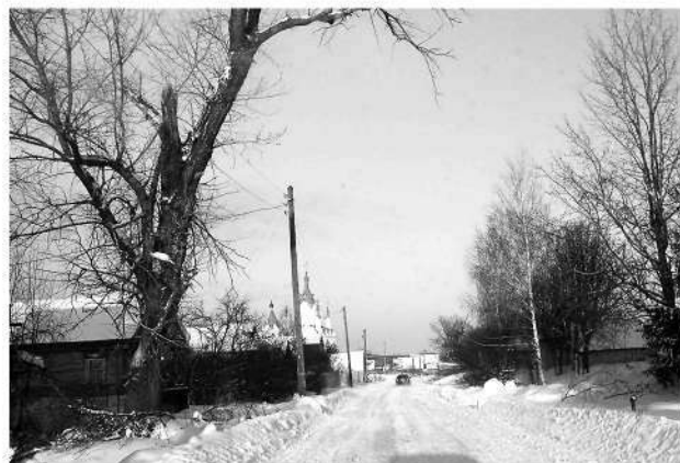
● Новые Березники: будет благоустроена дорога к храму