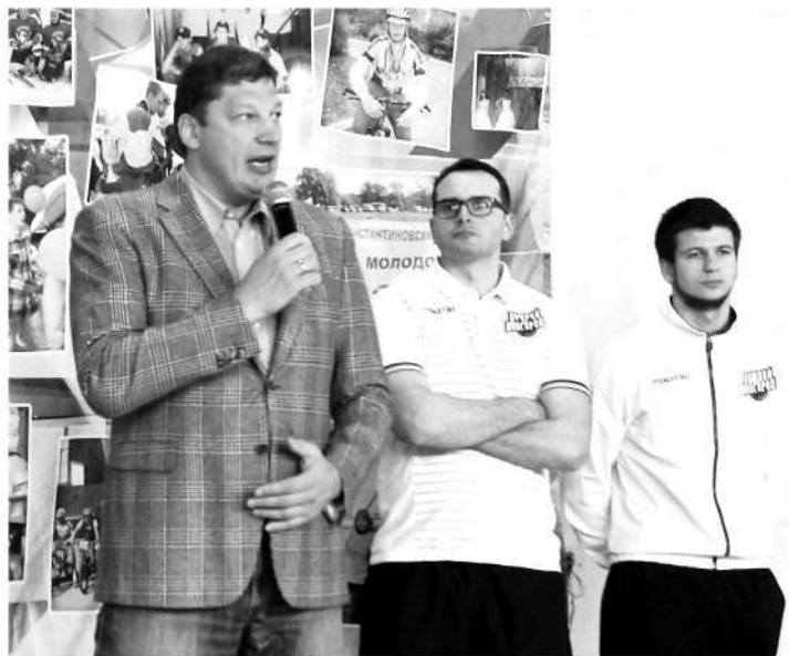
● Спортсменов приветствует министр спорта Нижегородской области Сергей Панов

После матча на Кубок администрации р. п. Д. Константиново министр спорта Нижегородской области Сергей Юрьевич Панов дал короткое интервью нашей газете, в котором поделился впечатлениями от игры и спортивными планами.