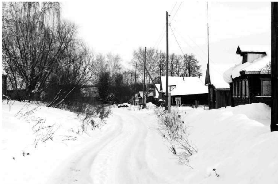
● Хорошо в деревне! Широки её просторы! Живи, Наченья!

До Наченья не близко, дорога, утопая среди снегов, ведет в гору. Раньше здесь населения было более 500 человек, и клуб, и школа, и магазин работали. А что сейчас?