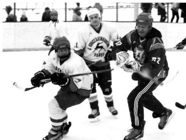
● В погоне за шайбой