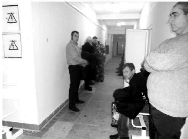
● В поликлинике всегдалюдно

В течение февраля и марта в помещении будут