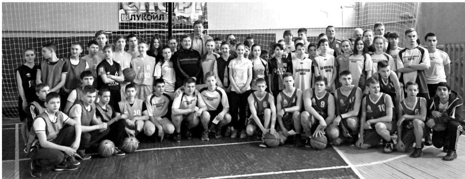
● Снимок на память, затем — раздача автографов

— Очень рад, что приглашают в маленькие населённые пункты. Это — база спорта, здесь можно встретить настоящих борцов. Конечно, работать нужно немало, моя задача — поделиться своими знаниями с тренерами, чтобы из любителей они вырос-