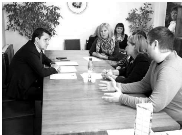
● «Продвигать» строительство школы в Румянцеве пришли и родители, и учителя

– У района большое будущее, этому способствует его расположение близ областного центра, также заработала объездная дорога, в связи с чем возможности района возрастают. Идет работа по привлечению сюда инвесторов, производств, без этого району тяжело. Но он находится в более выигрышной ситуации, чем другие районы. Сегодня мы с главой обсуждали возможности привлечения некоторых инвесторов, были некоторые пробле-