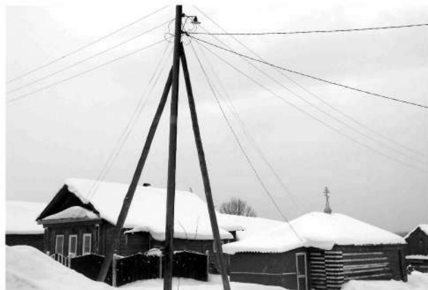
● Маргуша: по программе будет установлено 17 светильников