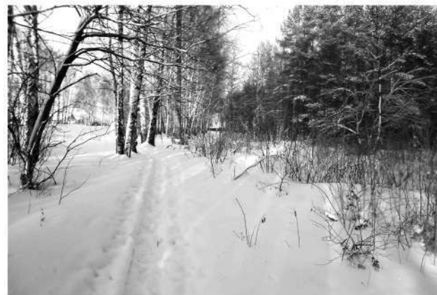
● В парке Д. Константинова планируют проложить дополнительно асфальтовые дорожки